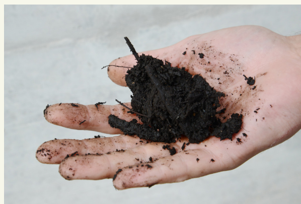
Kuva. 3: Nyrkkitesti: Kompostilla on oikea kosteuspitoisuus