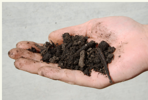
Kuva. 2: Nyrkkitesti: Komposti on liian kuiva.