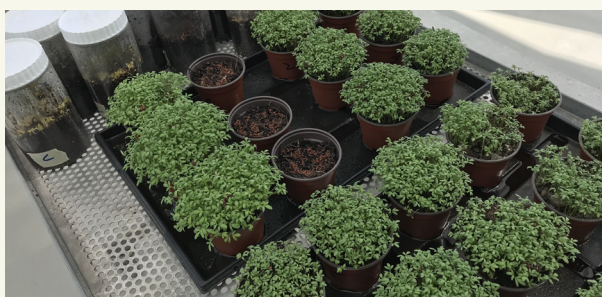
Kuva. 1: Suljettu ja avoin krakkitesti, 7 päivää kylvämisen jälkeen, valmis arvioitavaksi.

Kompostin on oltava kosteaa, jotta mikro-organismit voivat olla aktiivisia. Jos komposti on liian kuiva, mikro-organismien aktiivisuus ei ole mahdollista ja kompostin muuntaminen (kompostointi) keskeytetään. Jos komposti on liian märkä, tapahtuu ei-toivottuja mikrobi prosesseja anaerobisissa (= hapen puuttuessa) olosuhteissa ja kompostilla voi olla haju ja se sisältää fytotoksisia happoja. Yksinkertainen testi kompostin kosteuspitoisuuden kontrolloimiseksi on nyrkki-testi. Otat kourallisen kompostin, purista tiukasti ja avaa nyrkki. Jos komposti on liian kuiva, komposti putoaa sitten (kuva 2). Jos kosteuspitoisuus on normaalia, komposti pysyy yhdessä (kuva 3). Jos kompostia on liian märkää, vettä valuu nyrkistäsi puristaessasi kompostia (kuva 4). Tilanteesta riippuen voit ryhtyä tarvittaviin toimenpiteisiin, kuten lisätä vettä kompostiin tai peittää kompostin.