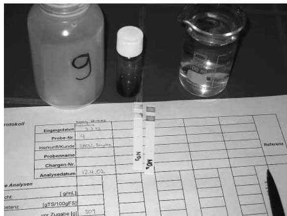
Abbildung 2: VKS-Aufbaukurs: Die Bestimmung von Nitrit und Nitrat aus dem Extrakt, die chemischen Analysen werden mit möglichst einfachen Mitteln, aber dennoch in einer genügenden Genauigkeit durchgeführt.

nur die wasserlösliche Humusfraktion (Fulvosäuren) und nicht auch noch die basisch lösliche Fraktion (Huminsäuren) berücksichtigt. Ein weiterer Vorteil dieser Methode besteht darin, dass sich die Extraktfärbung