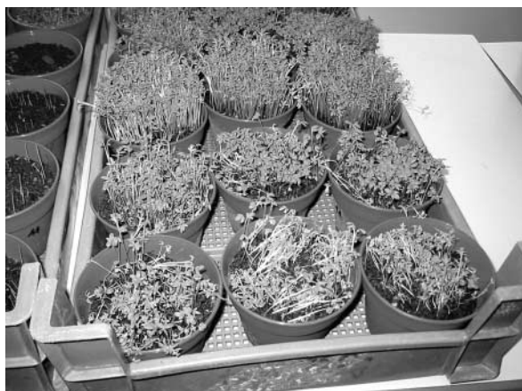
Abbildung 4: VKS-Aufbaukurs: Die Auswertung des Pflanzenwachstums erfolgt optisch (im Vordergrund Krankheiten) und nach Sprossgewicht.

entstehen recht schnell leicht wasserlösliche Humusverbindungen, welche den wässrigen Extrakt enorm dunkel färben. Aus diesem Grund kann die Extraktfärbung als Reifeparameter nur herangezogen werden, wenn die Zusammensetzung des Kompostes einigermaßen bekannt ist.