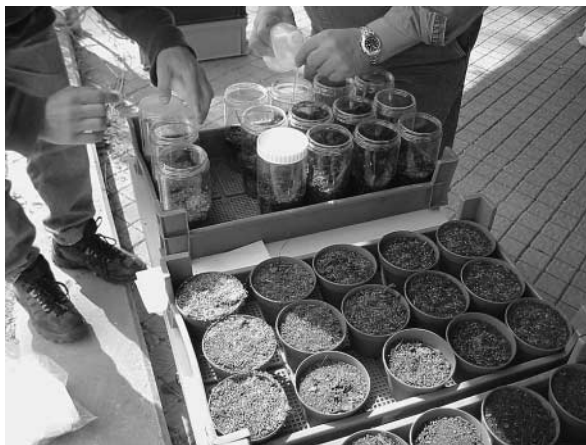
Abbildung 3: VKS-Aufbaukurs: Neben den chemischen Analysen interessiert die Pflanzenverträglichkeit. In jeweils 3 Töpfen werden die gleichen Pflanzensaat wiederholt, um eine stabilere Aussage zu erhalten.

aus dem selben Extrakt bestimmen lässt, in welchem auch der pH-Wert, der Salzgehalt, die Gehalte an Ammonium, Nitrit und Nitrat bestimmt werden.