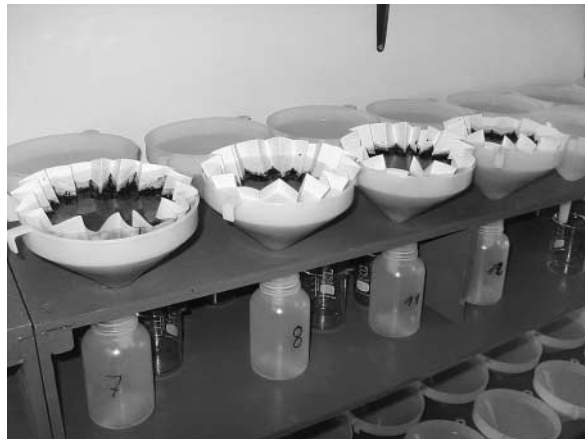
Abbildung 1: Im VKS-Aufbaukurs Qualitäten von Gärgut und Komposten wird die Qualitätsbestimmung auf den Anlagen geübt, hier die Extraktion für chemische Analysen

Bei der Bestimmungsmethode für die Extraktfärbung wird daher der Kompost nicht wie beim Humus-Test (erwähnt in Voitl und Guggenberger, 1986) mit EDTA haltiger Natronlauge extrahiert, sondern nur mit demineralisiertem Wasser, um anschließend die Extrakte mit genormten Farbreihen zu vergleichen und damit die Humuswerte zu bestimmen. Dadurch wird