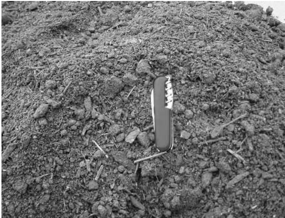
Abbildung 5: Mit anwendungsorientierten und regelmäßigen hohen Qualitäten soll die Nachfrage nach Komposten langfristig gesichert werden.

oder der Lagerung beeinträchtigen das Bohnenwachstum stark; insbesondere das Wurzelwachstum wird beeinträchtigt. Raygras braucht rasch verfügbaren Stickstoff aus dem Boden. Falls dieser Nährstoff im Kompost nicht verfügbar ist oder sogar fest gebunden vorliegt, wächst diese Pflanze deutlich schwächer. Der empfindlichste Test ist der geschlossene Kressetest. Denn bei diesem Test reagieren die Samen nicht nur mit dem Kompost, sondern auch mit den Gasen, die noch freigesetzt werden. Somit ist dieser letzte Test sehr nützlich um herauszufinden, ob ein Kompost reif genug ist für spezielle Anwendungen, wie zum Beispiel als Zuschlagmaterial für Setzlingsanzucht.