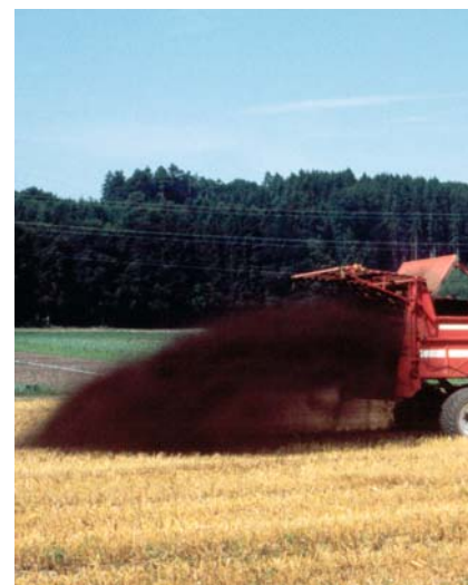
Kompoststreuer: Kompost aktiviert das Bodenleben und verbessert die Bodenstruktur.

Kurzfristig kann sich die Pflege der mikrobiologische Aktivität des Bodens leicht negativ auf den Pflanzenertrag auswirken. Mittel- und langfristig zahlt sich jedoch diese Investition für die Zukunft klar aus.