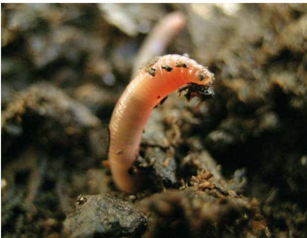
Schwerarbeiter im Dienst der Bodenfruchtbarkeit: Die Höhlen der Regenwürmer sorgen für gute Durchlüftung des Bodens.

Auch bei Neuanlagen, wo die Böden oft mehrmals umgeschichtet werden und das Bodenleben in ein Ungleichgewicht geraten kann, leistet Kompost wertvolle Dienste. Zwei bis drei Kubikmeter pro Are (Rekultivierungsdosis) in die obersten 30 cm der Flächen eingearbeitet, fördert Kompost den Aufbau und die Erhaltung des Bodenlebens. Allerdings muss dafür reifer Kompost eingesetzt werden, um einer übermässigen Stickstofffixierung vorzubeugen. Ein bis zwei Kilogramm Hornspäne pro Are geben den Pflanzen den notwendigen Stickstoffschub.