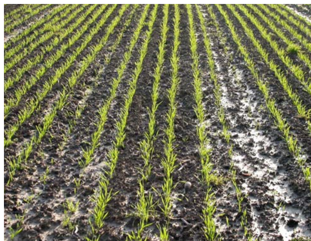
Bodenstruktur und Verschlammung: Nach heftigem Regen ist im langjährigen Dok-Versuch die rein mineralisch gedüngte Parzelle (links) viel stärker verschlammte und erosionsgefährdet als die mit Mistkompost gedüngte Parzelle (rechts). (Bilder: Andreas Fliessbach)